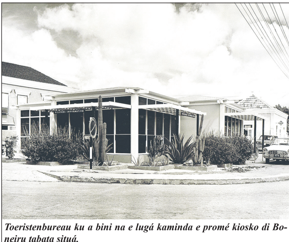
Toeristenbureau ku a bini na e lugá kaminda e promé kiosko di Boneiru tabata situá.